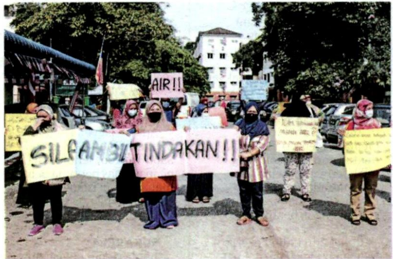
PENDUDUK Flat Bukit Tinggi Fasa 2 berkumpul bagi menunjukkan bantahan mereka terhadap kontraktor kerja pembaikan air di kawasan perumahan berkenaan.

“Malam-malam, kita hendak gunakan air untuk mandi, membasuh pakaian dan membersih-