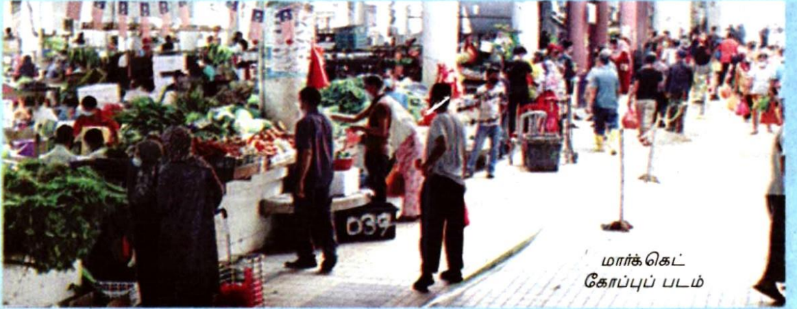
மார்க்கெட் கோப்புப் படம்