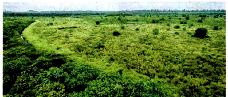
Majlis Mesyuarat Kerajaan Negeri Selangor pada 5 Mei lalu memutuskan kira-kira 536.70 hektar daripada keseluruhan kawasan HSKLU diluluskan untuk dinyahwarta.

"Kami juga menafikan sekeras-kerasnya tuduhan berkenaan dan menyifatkannya sebagai kenyataan yang berniat jahat dan subversif bagi merosakkan imej PKPS dan secara tidak langsung ingin mensabotaj ini-