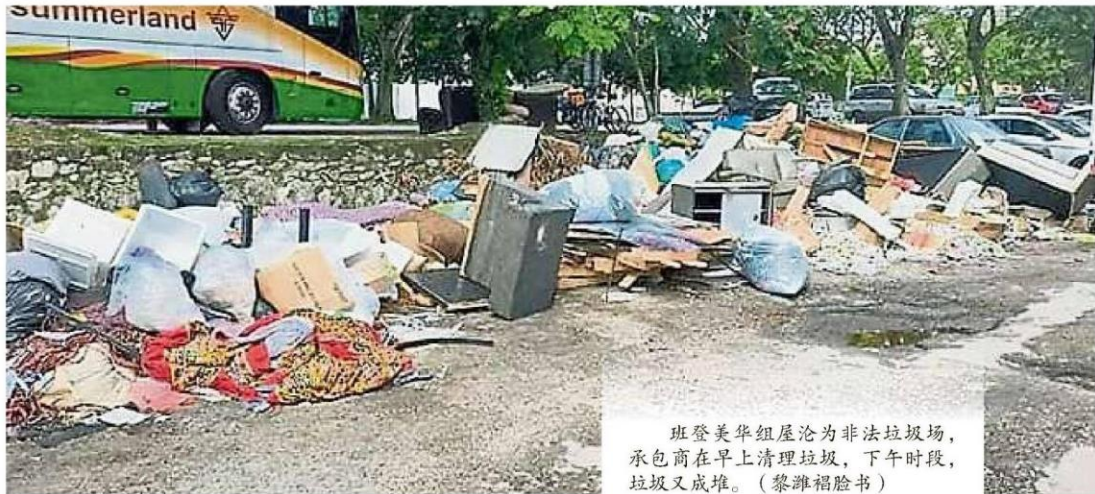
班登美华组屋沦为非法垃圾场，承包商在早上清理垃圾，下午时段，垃圾又成堆。