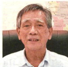
Mok says the field acts as a buffer zone from the commercial side.