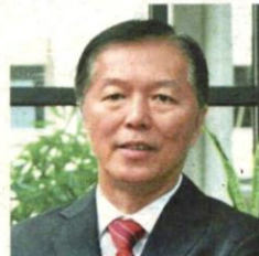
Tang points out that the field is crucial to provide active ageing.