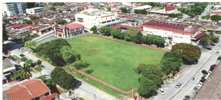
The Berkeley field is popular with residents in Taman Berkeley, Klang.

Green space provides Klang neighbourhood with social and environmental benefits, they say