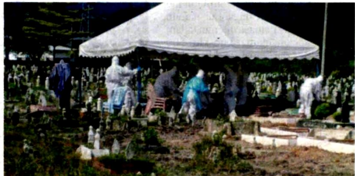
Aktiviti ziarah kubur dibenarkan dengan hadir memakai pelitup muka, menjaga penjarakan fizikal satu meter, mengimbas aplikasi MySejahtera dan melakukan ziarah pada masa yang dibenarkan sahaja.

“Mereka yang hadir perlu memakai pelitup muka, menjaga penjarakan fizikal satu meter, mengimbas aplikasi MySejahtera dan melakukan ziarah pada masa yang dibenarkan sahaja.